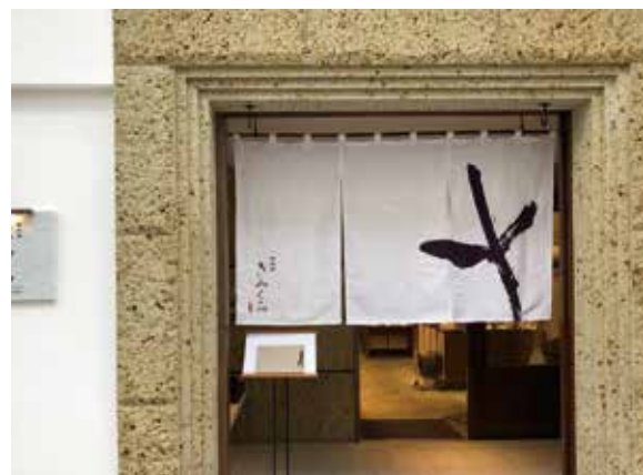
オリジナルのれん (きみくら静岡店 様)