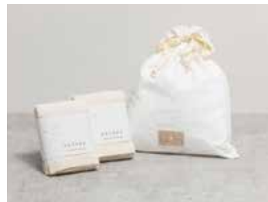
静岡タオルのギフト

※各商品の柄の種類はオンラインショップをご参照ください。 オンラインショップで販売中の柄はご注文いただけます。 在庫状況によっては対応できない場合がありますのでご了承ください。