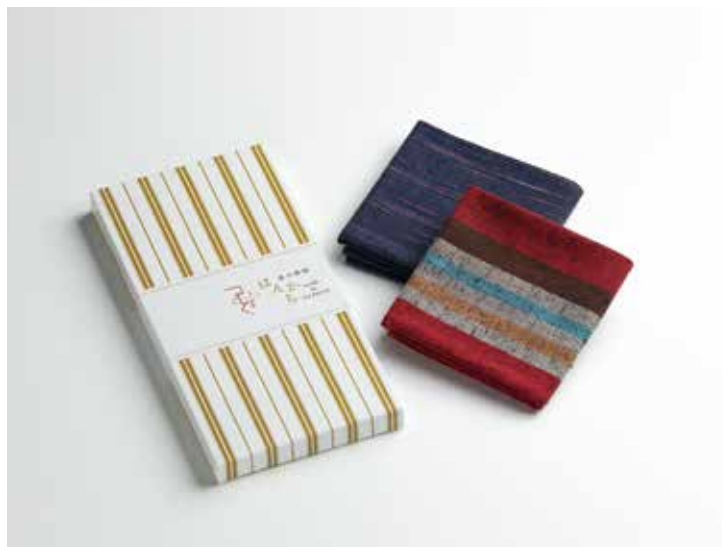
つむぐ はんかちギフト (はんかち2枚箱入り)