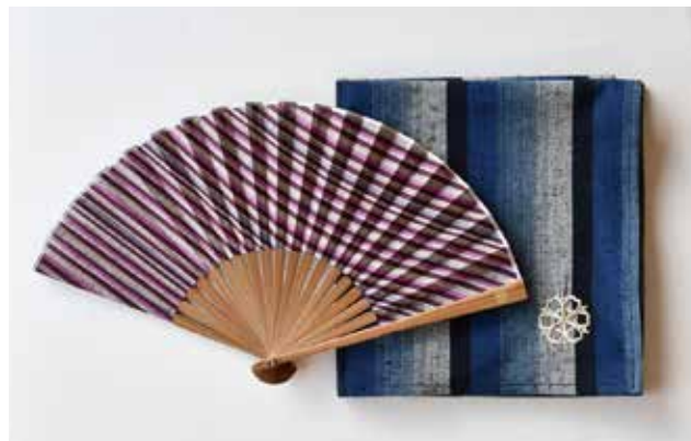
入寺・退寺の記念 扇子&ふろしき (東漸寺 様)