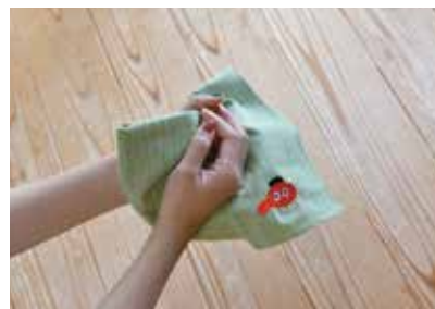
オリジナルロゴ刺繍はんかち (遠州天狗屋 様)