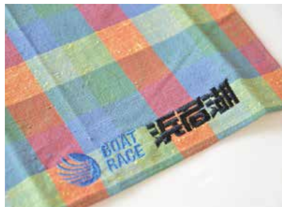
ヤングダービー 記念はんかち (BOAT RACE 浜名湖 様)

お客様のご要望に合わせて、当社スタッフが 一緒に考えながら最良の形をご提案いたします。 まずはお気軽にご相談ください。