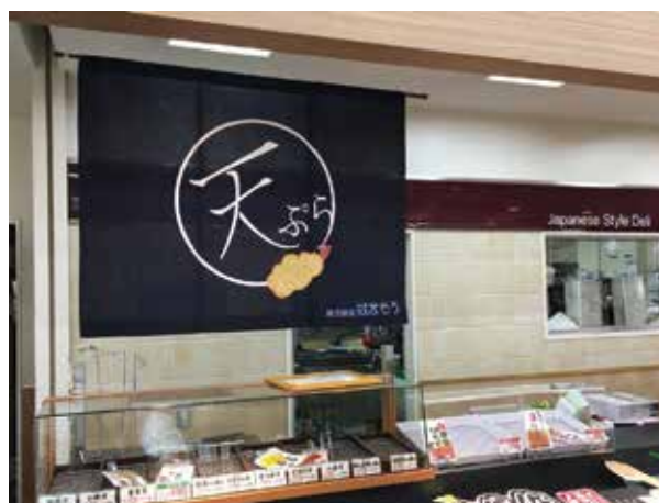
オーダーのれん (はまそう様)