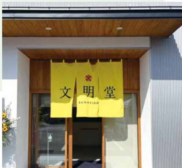
オーダーのれん (浜松文明堂様)

個人宅ののれんから、店舗用ののれんまでお客様のご要望に応じて、生地から選べます。サイズも自由に対応できますのでお気軽にご相談ください。