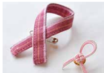
遠州綿紬・水引で制作したピンクリボン (日本乳癌検診学会学術総会 様)