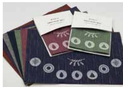
神棚の里×遠州綿紬コラボ「お祀りマット」 (神棚の里 様)