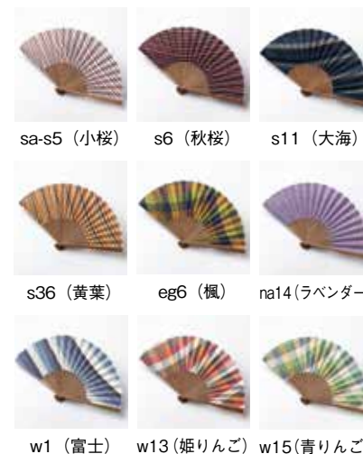
sa-s5 (小桜) s6 (秋桜) s11 (大海) s36 (黄葉) eg6 (楓) na14 (ラベンダー) w1 (富士) w13 (姫りんご) w15 (青りんご)

扇面の起伏によってあらわれる生地表情が美しい、遠州綿紬の扇子。 末広りの縁起物として、年代を問わず贈り物にも喜ばれています。