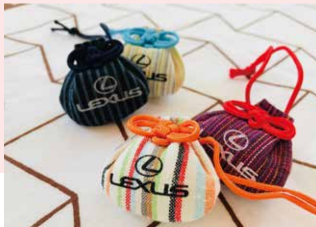
交通安全のご祈禱をしたお守り (レクサス和田店 様)