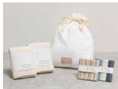
静岡タオルとはんかちのギフト