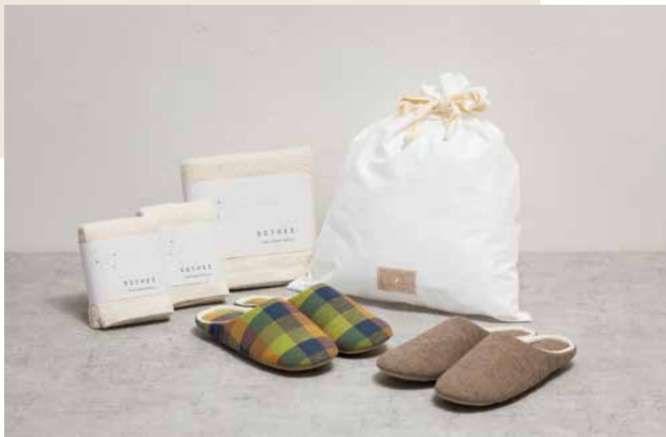
スリッパと静岡タオルの贈り物