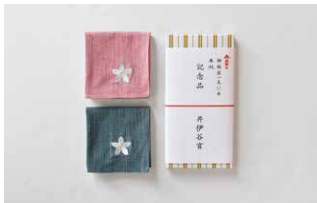
御祭神「宗良親王」御鎮座150年 記念はんかち (井伊谷宮 様)